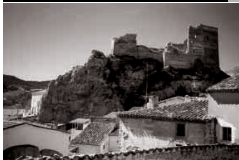
Castillo de Villel de Mesa