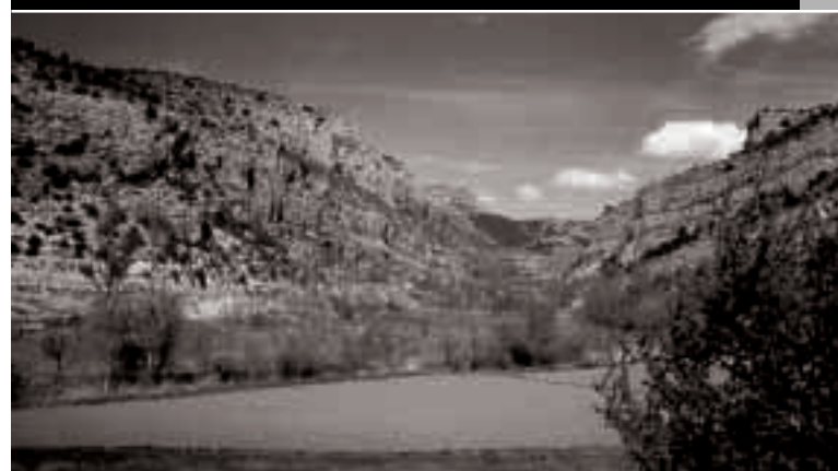
Paisaje en el río mesa, cerca del limete de la provincia de Zaragoza