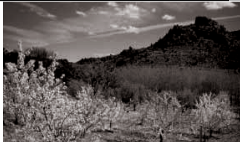
Primavera en el valle del Mesa

A 2,5 Km de la bifurcación del barranco Hondo nos encontramos con otro cruce: nuestro camino se desdobra en dos, ambos van a Amayas, seguiremos el de la izquierda durante 100 metros, en que toma una dirección E. que no nos conviene. Seguiremos la dirección N., cruzando el barranco de Ceca, y pasando cerca de dos parideras (los corrales de los Altos Arenales), tomando en la segunda la dirección NO., y ascendiendo hasta asomarnos al río, dejando el Cabez a nuestra izquierda. Desde aquí la senda desciende, y sigue la dirección N., hasta enlazar con la carretera de Amayas-Mochales, seguiremos hacia la izquierda la carretera durante 2,5 km., y regresaremos al punto de partida: Mochales, donde termina nuestra ruta.