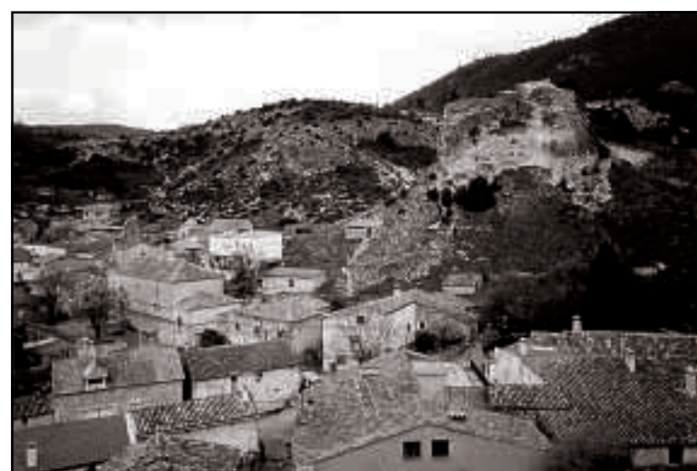
Ocentejo, inicio y fin de nuestra ruta.