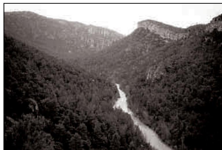
El hundido de Armallones desde el cerro Alar.

Tras el estrechamiento del cañón en el Hundido de Armallones, la pista asciende y gira al O. primero, y al NO. después, para llegar a Ocentejo localidad donde finaliza nuestra ruta.