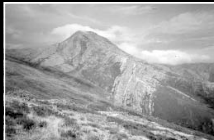
El Ocejón desde el camino de Almiruete