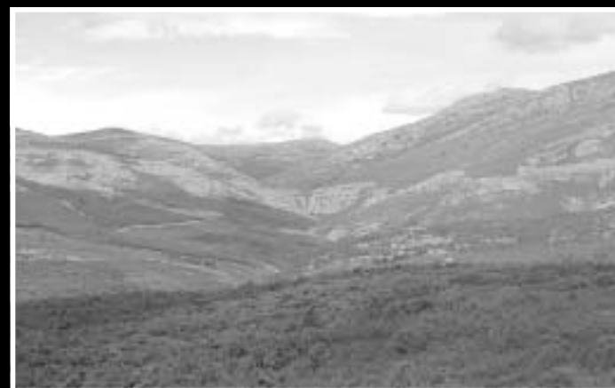
Valverde de los Arroyos y las chorreras