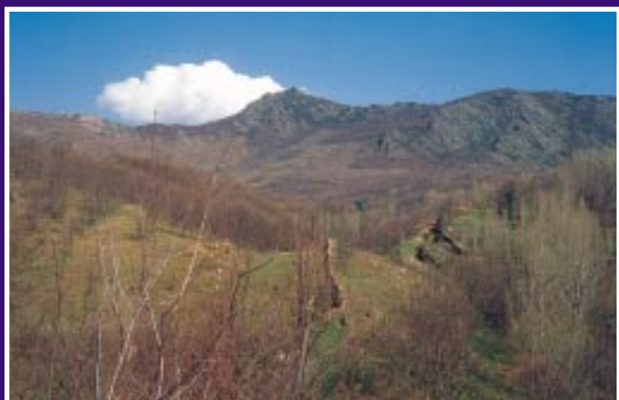
Paisajes de la ruta