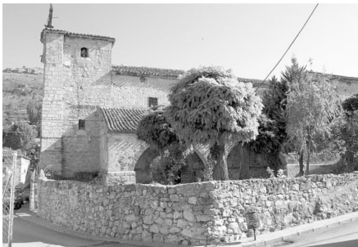
Peralejos ofrece rincones de gran belleza en el Alto tajo

El itinerario tiene una variante, es mas dura y complicada, y se trata de ir por la orilla del río Tajo, buscando las sendas de pescadores, pero en varios momentos hay que ascender, ya que hay tramos del río en los que la senda casi desaparece.