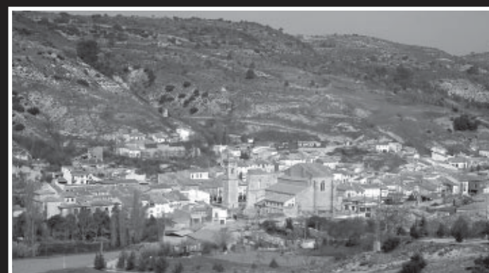
Panorámica de Tendilla