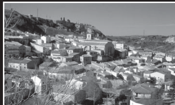
Vista de Peñalver

por 16 tablas del maestro de la Ventosilla. Hay también en una extraordinaria talla en alabastro sin colorear, de la Virgen del Rosario, bajo un Calvario, que corona el conjunto.