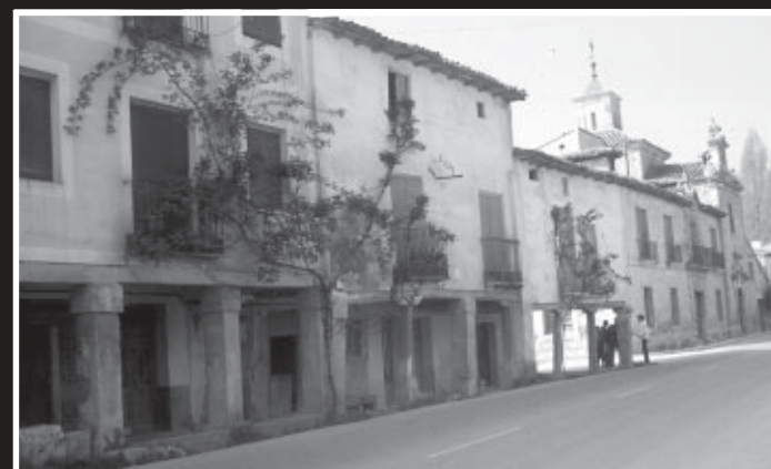
Soportales de Tendilla