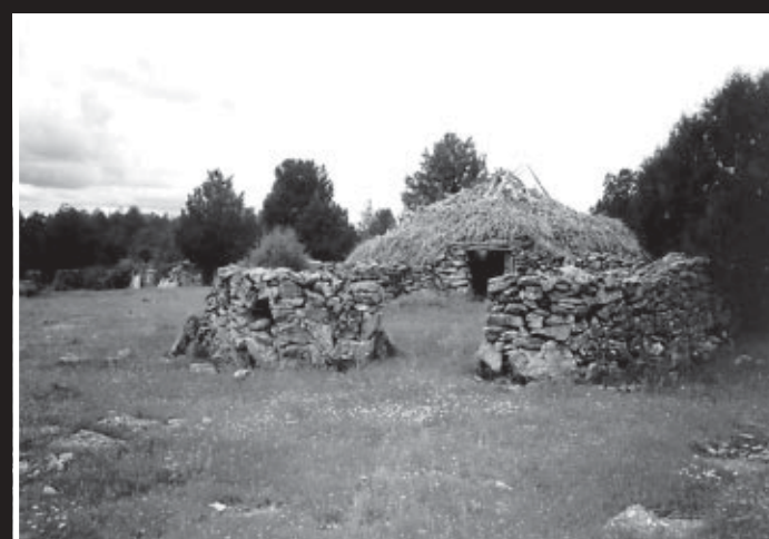
Imágenes de la ruta.